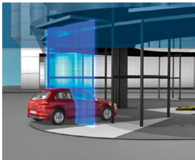
2: Hochpräzise Fahrzeugvermessung.

den Roboter, die Stellplatzanordnung, die computergestützte Vermessung und das Dual-Liftsystems umfassen, ergeben eine Verbesserung der Raumnutzung von bis zu 400 % gegenüber herkömmlichen Parkhäusern. Bereits ein Grundstück von nur 20 × 20 Metern ermöglicht den Bau eines Turmes oder eines unterirdischen Schachtes mit bis zu 320 Parkplätzen. Die Vorteile dieser neuen Technologie kommen vor allem dort zum Tragen, wo der Raum knapp, teuer oder für konventionelle Anlagen extrem begrenzt ist, so zum Beispiel in Innenstädten, an Flughäfen, bei Bahnhöfen, in Hotels oder Spitälern. Durch den wesentlich geringeren Platzbedarf ergibt sich zudem ein stark reduzierter Aushubaufwand, was die Erstellungskosten pro Parkplatz bis zur Hälfte reduzieren kann.