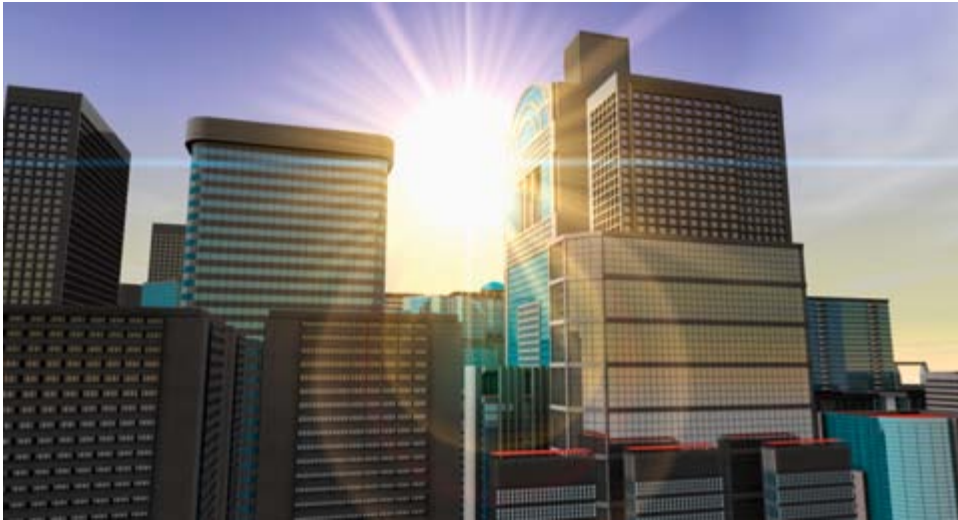
3: Parklösung, wo Raum knapp und teuer ist.